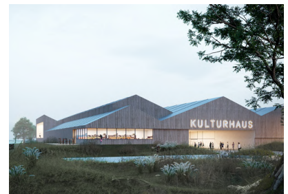
Kulturhaus auf der Freiheit in Schleswig