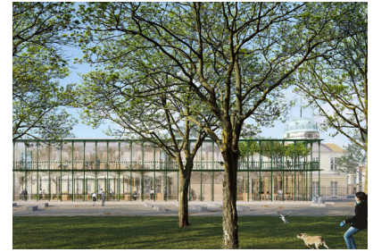
Besucherzentrum Schloss Charlottenburg in Berlin