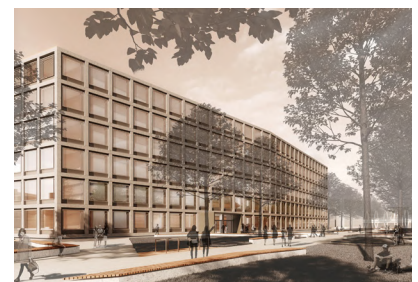
Laborgebäude Beuth Hochschule für Technik in Berlin