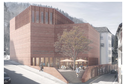
Dokumentations- und Kulturzentrum Deutscher Sinti und Roma in Heidelberg