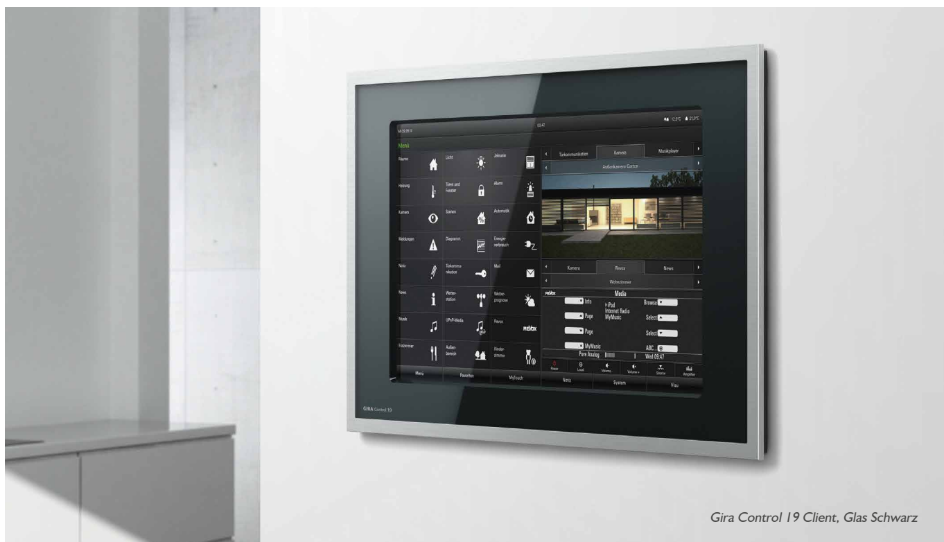
Gira Control 19 Client, Glas Schwarz

Der Gira Control Client, ein PC-basiertes Bediengerät für den Gira Home-Server, ermöglicht eine einfache und bequeme Steuerung der gesamten Gebäudetechnik via Touchscreen mit nur einem Finger – und das weltweit!