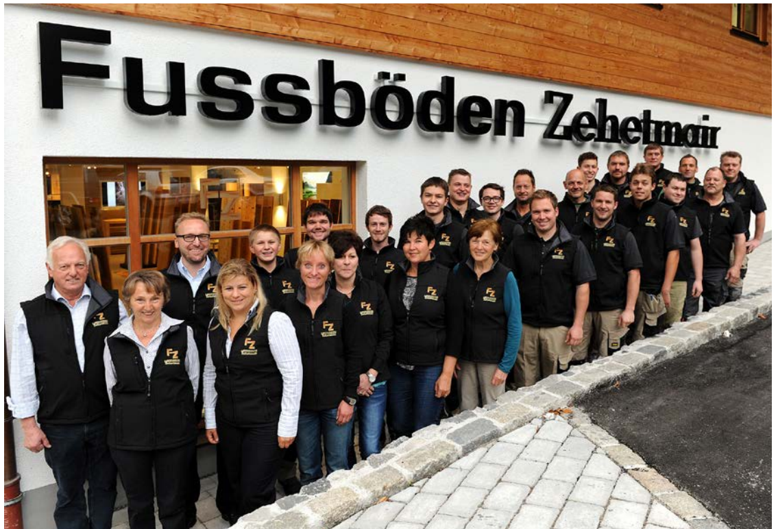
Qualität funktioniert mit qualifizierten Mitarbeitern.