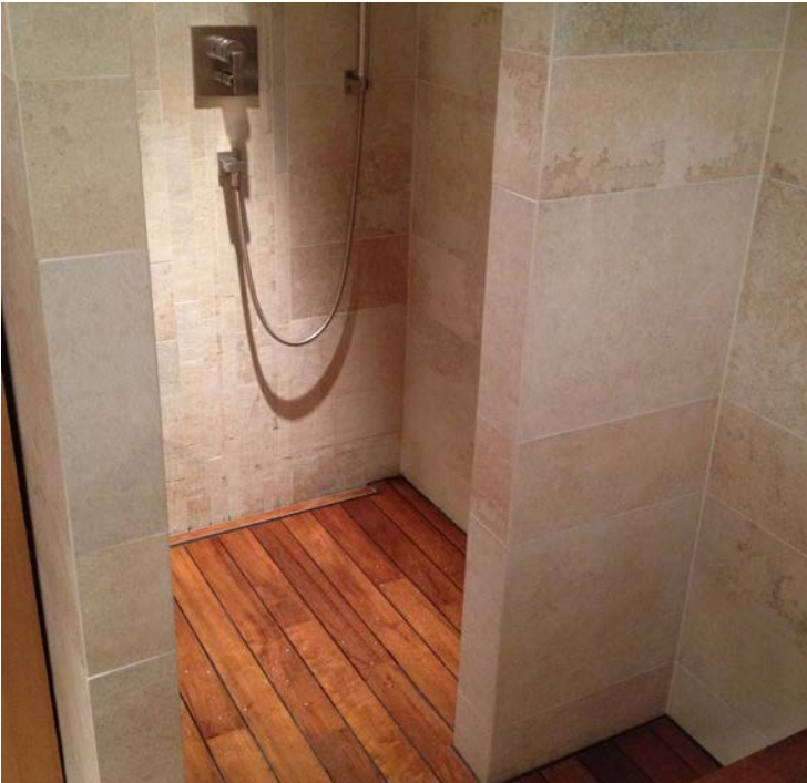
Yacht-Optik - Dusche mit Burma-Teak-Holzboden

Eine wichtige Rolle im neu gestalteten Ladengeschäft spielt auch die moderne Lichttechnik mit LED-Lampen. Sie bringt Holztöne und Maserungen unverfälscht zur Geltung. Zusätzlich setzen die Lichtquellen Akzente, heben bestimmte Bereiche optisch hervor und lassen die Präsentation auf diese Weise lebendig wirken. „Ein weiterer Vorteil der LEDs ist ihr niedriger Stromverbrauch“, fährt Zehetmair fort. Er hat sich entschieden, die Ausstellung auch außerhalb der Geschäftszeiten zu beleuchten und damit Pendlern