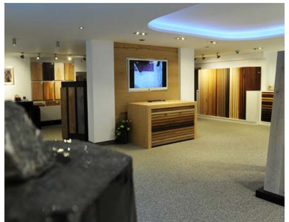
Der neue Verkaufsraum setzt edles Parkett wirkungsvoll in Szene. Aufwendige Lichttechnik setzt Akzente und gibt Farben und Oberflächen naturgetreu wieder. Auf dem Flachbildschirm lassen sich Parkettlösungen in konkreten Raumsituationen darstellen.