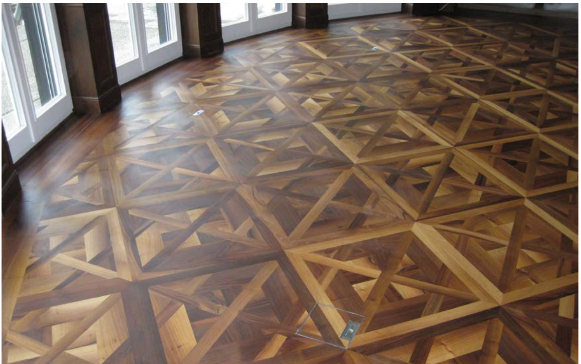
Tafelparkett in schweizer Nussbaum