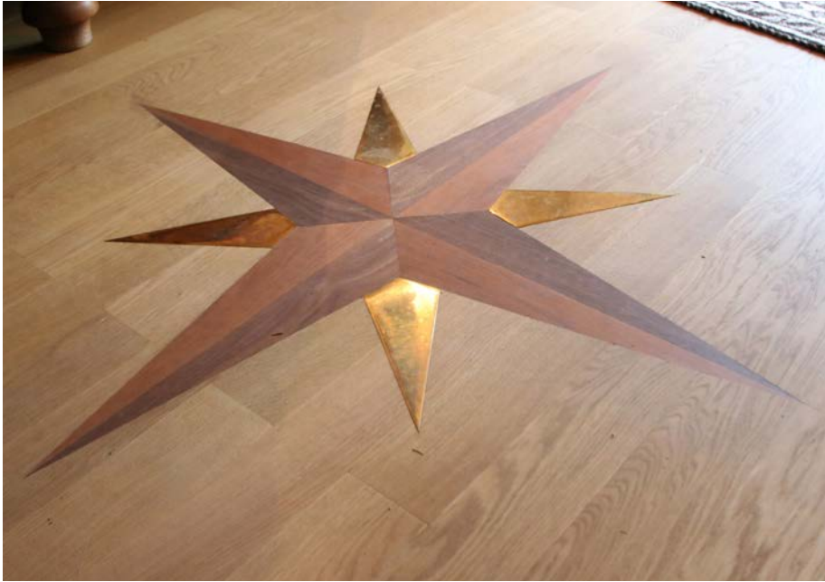
Stern-Intarsie Kirsch/Nuss/ Messing