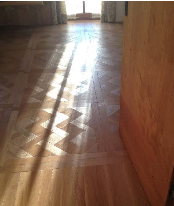
Versailler-Tafelparkett Eiche Antik

Zehetmair bietet nicht nur Holzböden, sondern fast das gesamte Bodenbelagsspektrum. Elastische und textile Beläge sind außerhalb des Blickfeldes arrangiert. „Sie sind speziell im Objekt wichtig“, führt Zehetmair aus. Nur ein Produkt findet man hier nicht: Laminatböden. „Ich bin Holzspezialist und verkaufe lieber das Original“, erklärt der Inhaber. Highend-Teppichböden und luxuriöse Teppiche haben zusammen mit Dekos ihre eigene Welt in einem angrenzenden Raum erhalten – „als Pendant und Ergänzung zu den hochwertigen Parkettböden“. Auch Treppenlösungen und Wandgestaltungen mit Altholz werden laut Bernhard Zehetmair zunehmend nachgefragt. Deshalb wurde das neue Treppenhaus nebenan als Musterfläche gestaltet: Die Treppe zeigt jetzt verschiedene Varianten für den Einbau von Tritt- und Setzstufen. Auch die Regale mit Pflegemitteln und Zubehör haben hier ihren Platz gefunden. Die Wandgestaltung im Eingangsbereich aus verwittertem Erlen-Altholz wirkt modern und vermittelt gleichzeitig einen Bezug zum Ursprungsmaterial.