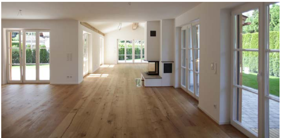
Eiche-Langdielen mit Rissen