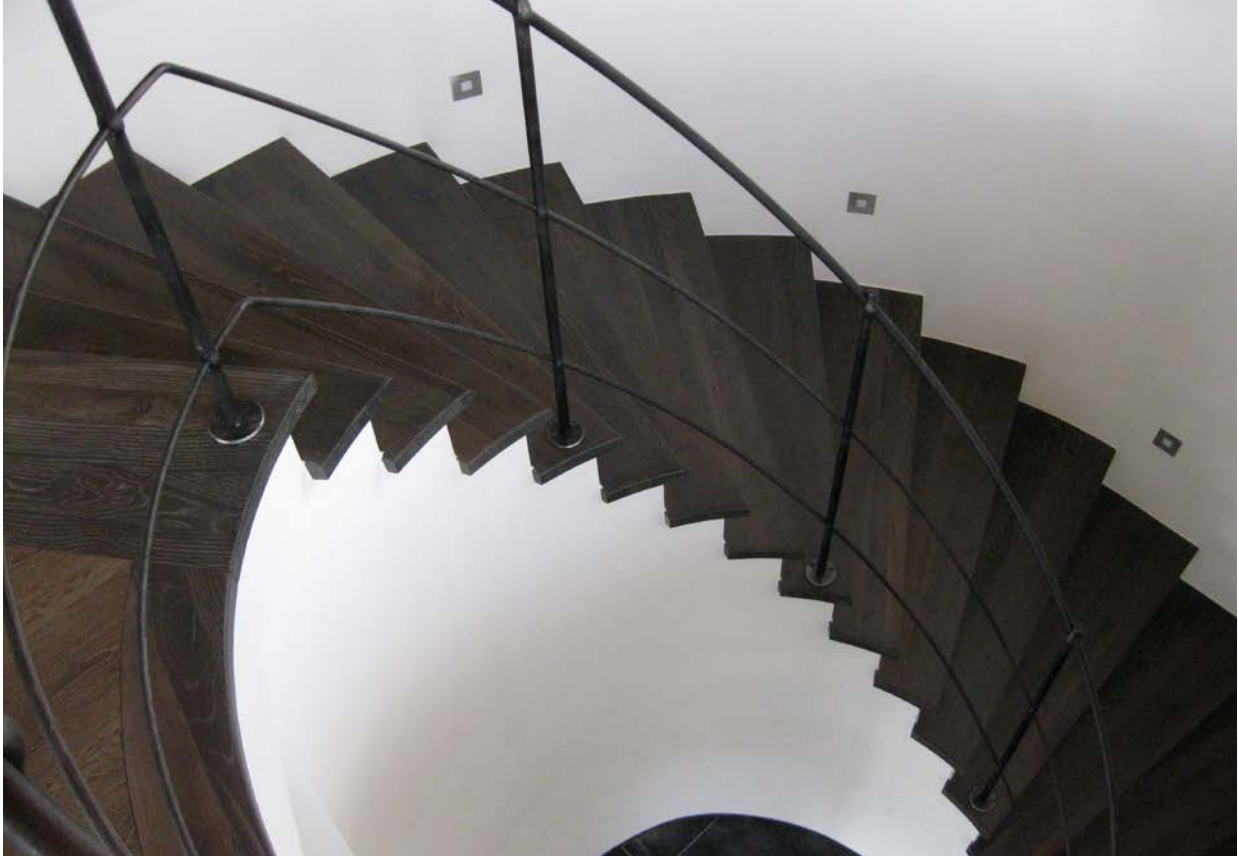
Runde Treppe in Räuchereiche