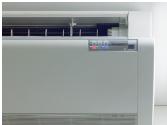
Auf Wunsch liefern wir Ihnen zur Kühlung und Teilentfeuchtung Schalträume mit vorinstallierter Klimaanlage.

■ Durch unsere langjährige europaweite Erfahrung sind wir Ihnen ein kompetenter Partner in Sachen Systembau. Wir bieten Ihnen konzeptionelle Schaltraumelemente in verschiedenen Größen und Varianten oder individuell ganz nach Ihren Wünschen.