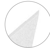
45° SCHRÄGE FASE