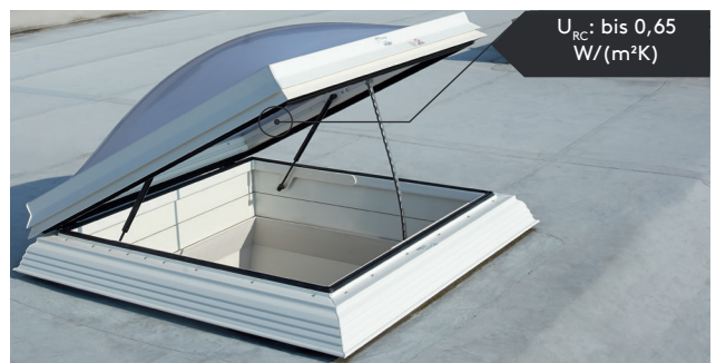
Lichtkuppel neo plus mit Dachausstieg Typ G und LM-Kettenantrieb