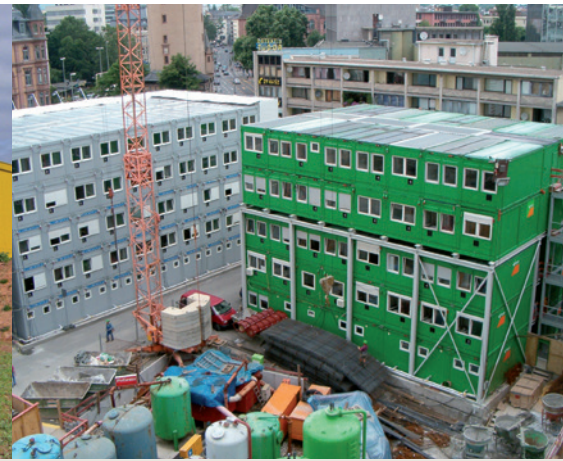
▲ Versorgung einer Containeranlage mit 144 Büro- und Tagesunterkuntscontainern