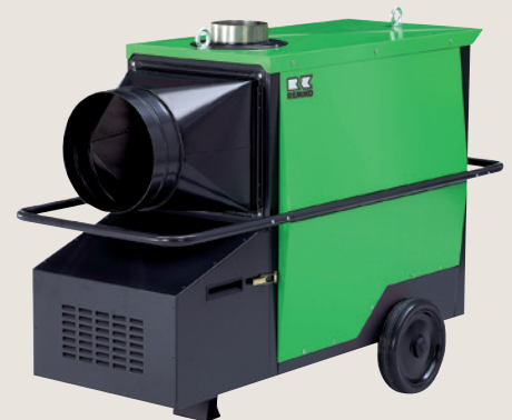
▲ Stationärer, indirekt befeuerter Gaslufterhitzer