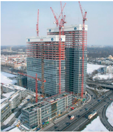
▲ Winterbaubeheizung von zwei Hochhäusern, einem Büro- und einem Hotelkomplex