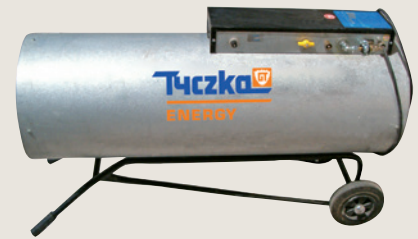
▲ Mobiler, direkt befeuerter Gaslufterhitzer