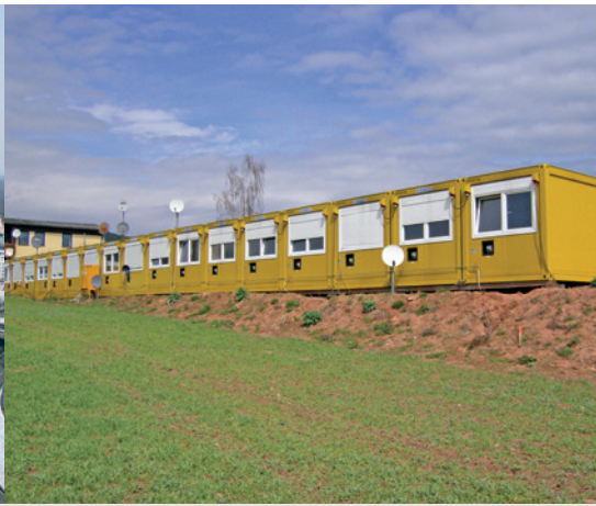
▲ Versorgung einer Containeranlage mit 36 Wohn- und Sanitärcontainern