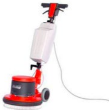
Bodenreinigungsmaschine mit rotierendem Drehkopf