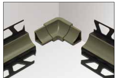
Innenecke I2 (2 Abgänge)