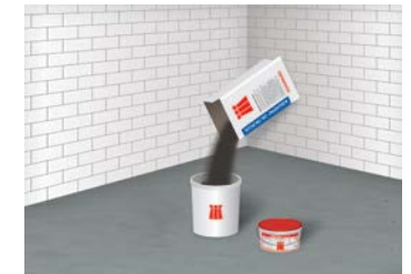
4 Einfüllen der Abdichtung im vorgegebenen Mischungsverhältnis