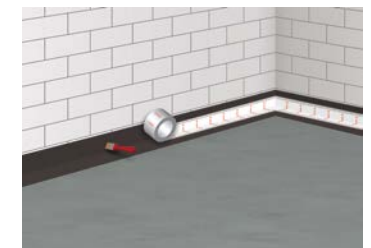
6 Verkleben der ASO-Dichtbandtechnik in den 1. Auftrag der Abdichtungsschicht