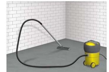
2 Reinigen des Untergrundes