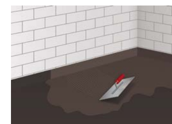
9 Auftrag der 2. Abdichtungsschicht