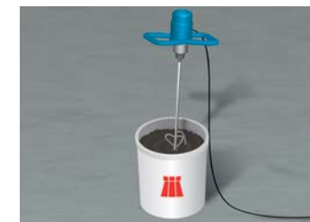
5 Anmischen der Abdichtung