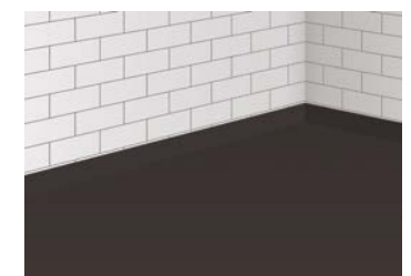
8 1. Abdichtungsschicht trocknen lassen