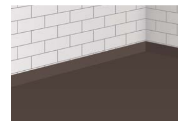
10 Fertige, belegreife Abdichtung