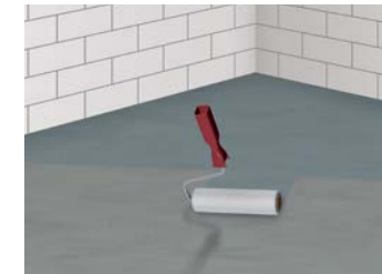
3 Grundieren des Untergrundes, z. B. mit ASO-Unigrund