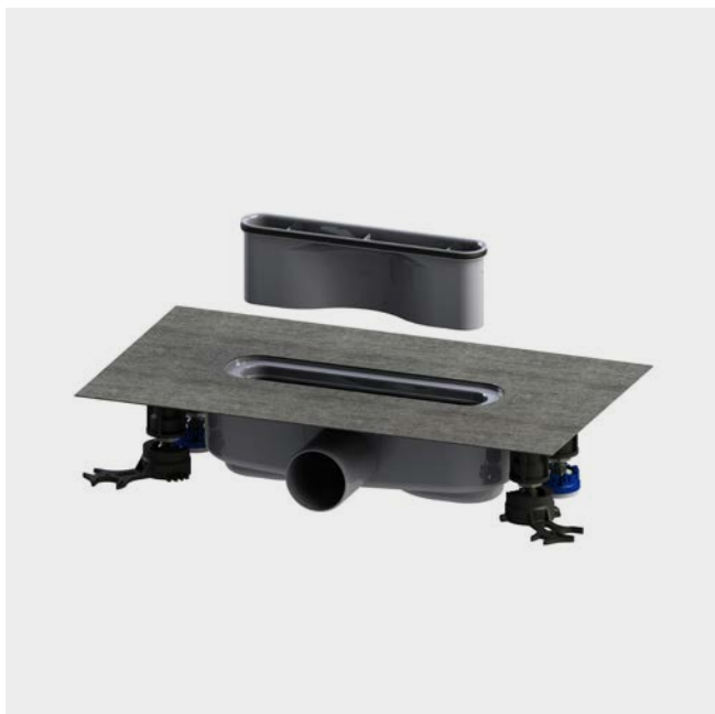
FLOWDRAIN HORIZONTAL REGULAR