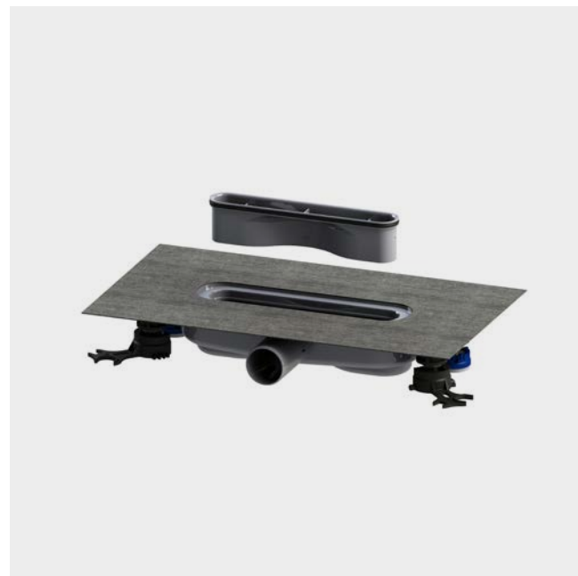
FLOWDRAIN HORIZONTAL FLAT