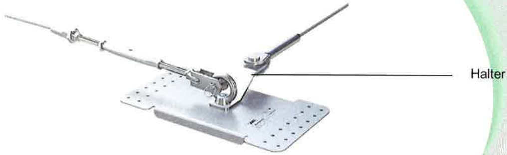
Bild 3: Anschlageinrichtung, Typ: ABS-Lock® X-RIVET mit gekantetem Halter und Endhalter (Ringschraube M16)