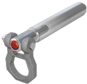
ABS-Lock I Abnehmbarer Anschlagpunkt für Aufnahmhülse ABS-Lock II