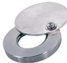
ABS-Lock II Steel Cover Edelstahl-Abdeckklappe für Anschlagpunkt ABS-Lock I-II