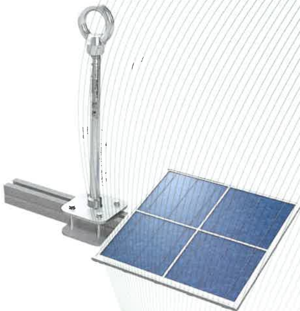
Bild 1: Anschlageinrichtung, Typ: ABS-Lock® X-Solar, montiert an Aluminiumschiene (Montagebeispiel)

Die Anschlageinrichtung ist für die Beanspruchung in alle Richtungen vorgesehen und besteht aus korrosionsbeständigem Stahl.