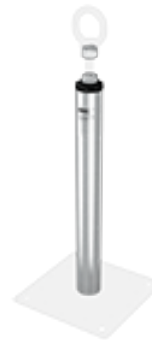
ABS-Lock X Stützrohr Edelstahl-Verstärkung für Anschlagpunkte des Typs ABS-Lock X