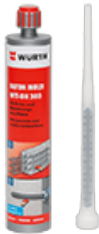
Verbundmörtel WIT Montagemörtel für Beton und Mauerwerk