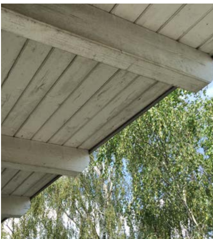
Tauwasser, z. B. auf Dachuntersichten oder gedämmten Fassaden, erhöht das Befallrisiko.