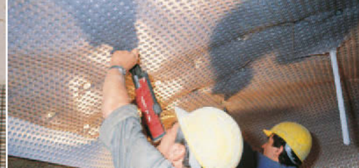
Im Tunnel dient DELTA®-PT als Träger für Spritzbeton.