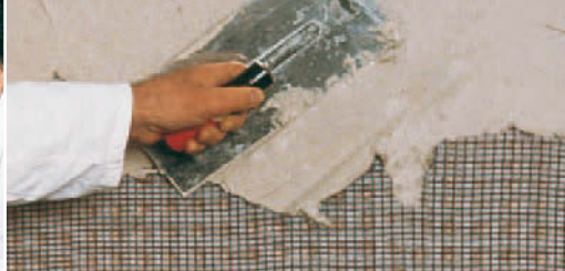
Putz einfach mit der Kelle aufziehen.