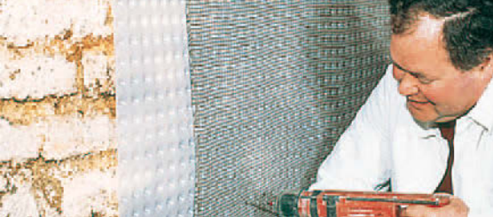
Leichte Befestigung auf der Wand.