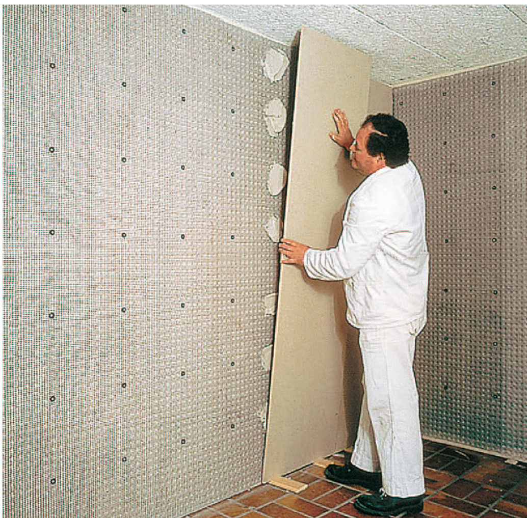
DELTA®-PT bildet eine wasserdichte und stabile Basis für Gips- und Kalkzementputz oder Gipskartonplatten.