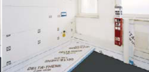
Sichere Abdichtung in Nassräumen.