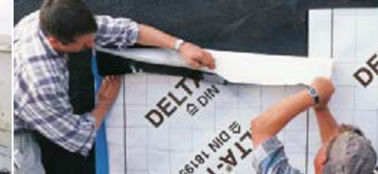
Zuverlässiger Schutz von Kellerwänden.