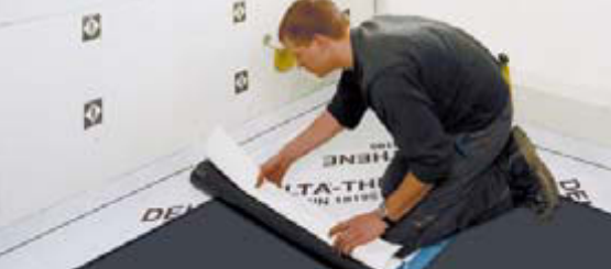
Schnelle Verarbeitung von der Rolle.