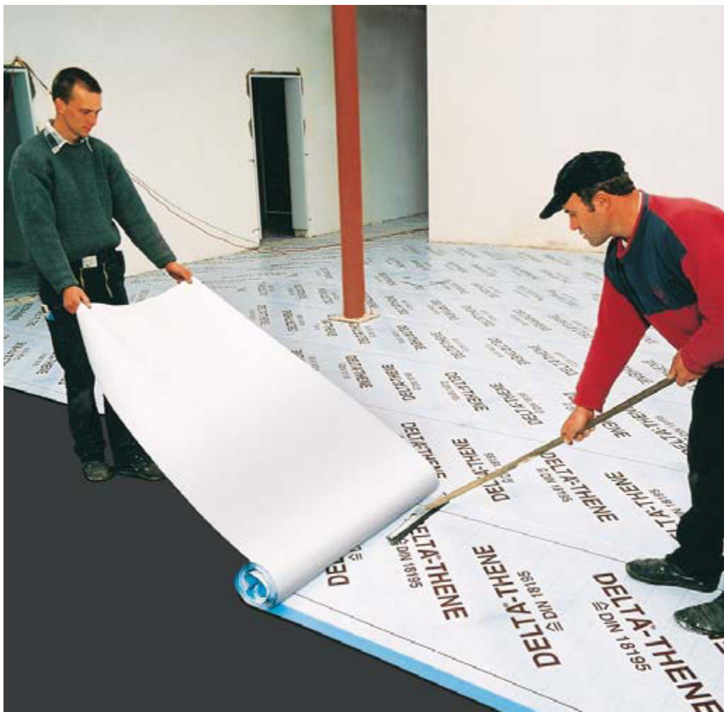
Große Flächen können mit DELTA®-THENE ganz einfach und ohne Unebenheiten abgedichtet werden.