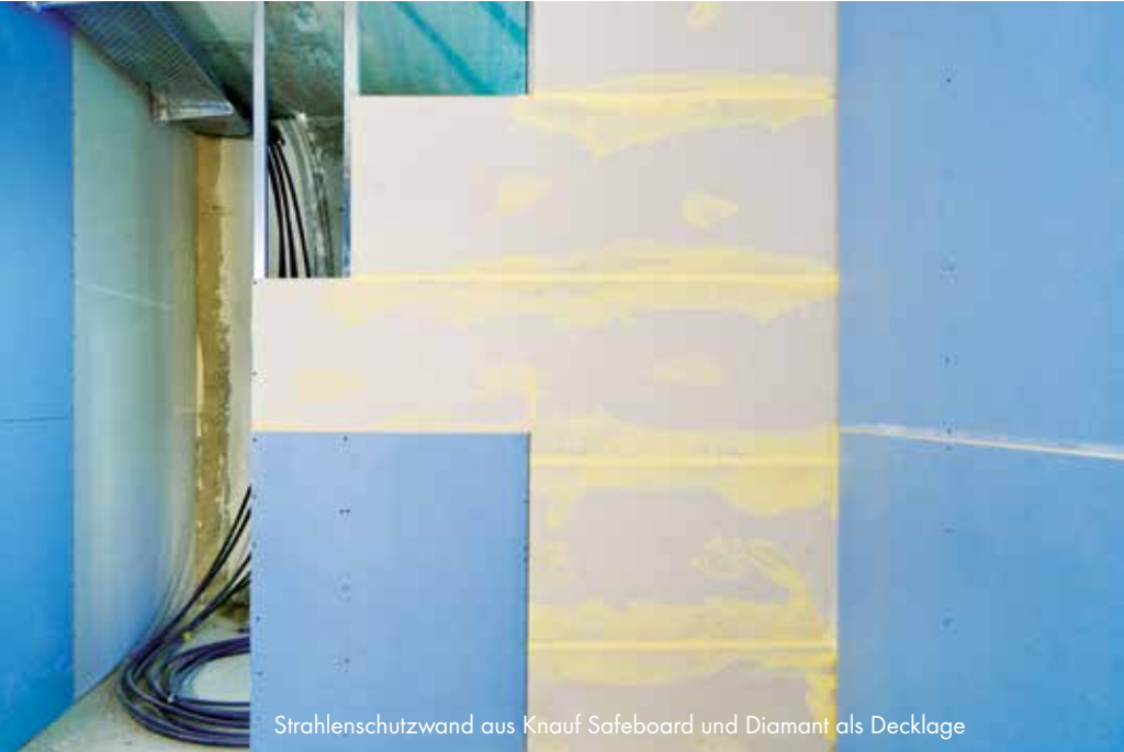
Strahlenschutzwand aus Knauf Safeboard und Diamant als Decklage