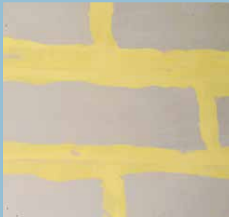
Knauf Safeboard – Verfüguung mit gelbem Safeboard-Spachtel für höchste Sicherheit.