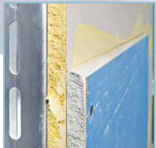
Knauf Safeboard – einfache Sichtkontrolle durch gelben Kern.

Blei war gestern – Knauf Safeboard ist heute.