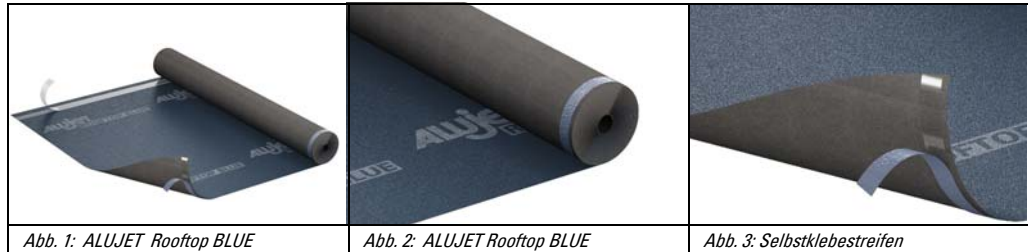
Abb. 1: ALUJET Rooftop BLUE