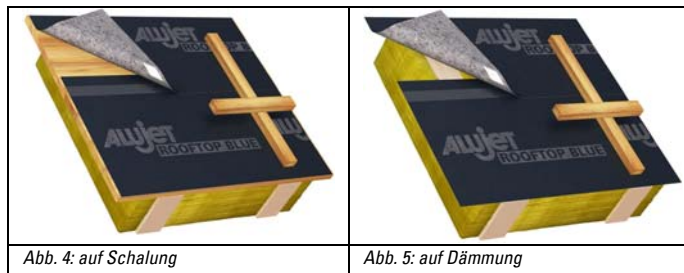
Abb. 4: auf Schalung