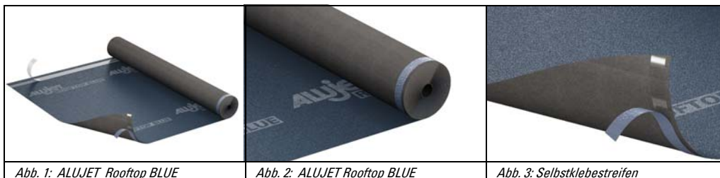
Abb. 1: ALUJET Rooftop BLUE