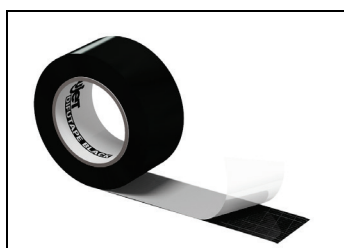
Abb. 1: ALUJET Difutape BLACK