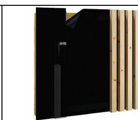
Abb. 2: Einsatz Fassade