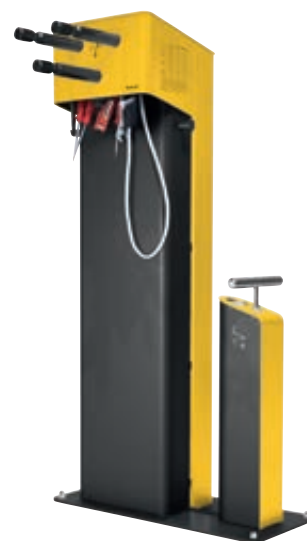
▲ Servicestation CARY, Gehäuse in RAL 1023 verkehrsgelb