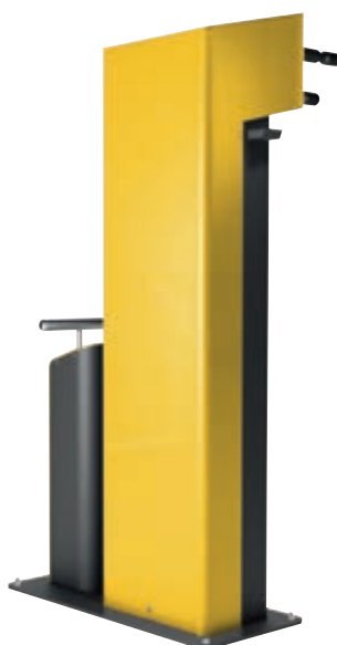
▲ Servicestation CARY, Ausführung Basic, Gehäuse in RAL 1023 verkehrsgelb