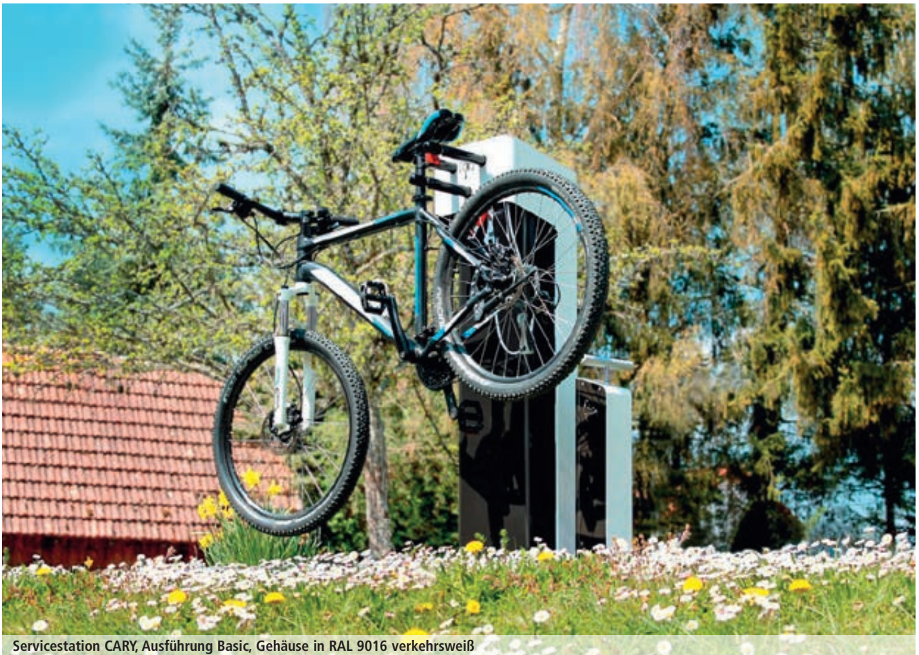
Servicestation CARY, Ausführung Basic, Gehäuse in RAL 9016 verkehrsweiß

Die moderne Fahrrad-Servicestation CARY ist ein praktisches Hilfsmittel, um die Mobilität von Radfahrern auch im Falle einer Fahrradpanne zu gewährleisten. Die robuste Servicestation aus deutscher Produktion bietet neben dem notwendigen, sicher aufbewahrten Werkzeug und einer Luftpumpe eine integrierte Reifenlickauflage sowie eine Helmhalterung. Ein hochwertiger Fahrradhalter sorgt für eine rutschsichere Fahrradaufnahme und zwei lange, extra verstärkte Reifenheber ermöglichen eine felgenschonende Reparatur.