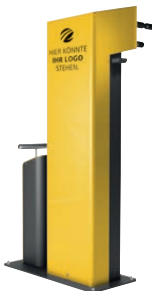
▲ Servicestation CARY, Ausführung Performance, Gehäuse in RAL 1023 verkehrsgelb