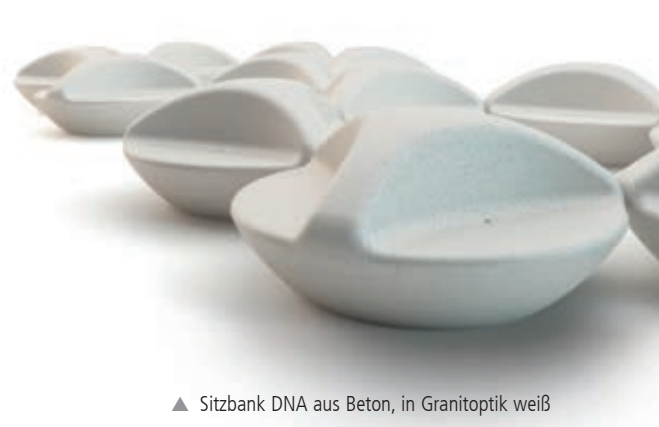
▲ Sitzbank DNA aus Beton, in Granitoptik weiß