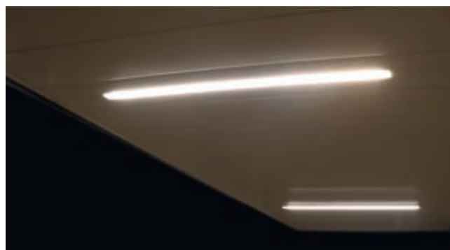
▲ Deckenverkleidung mit LED