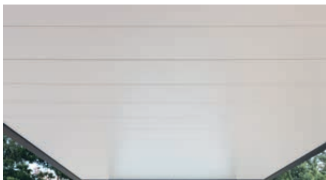
▲ Deckenverkleidung ohne LED