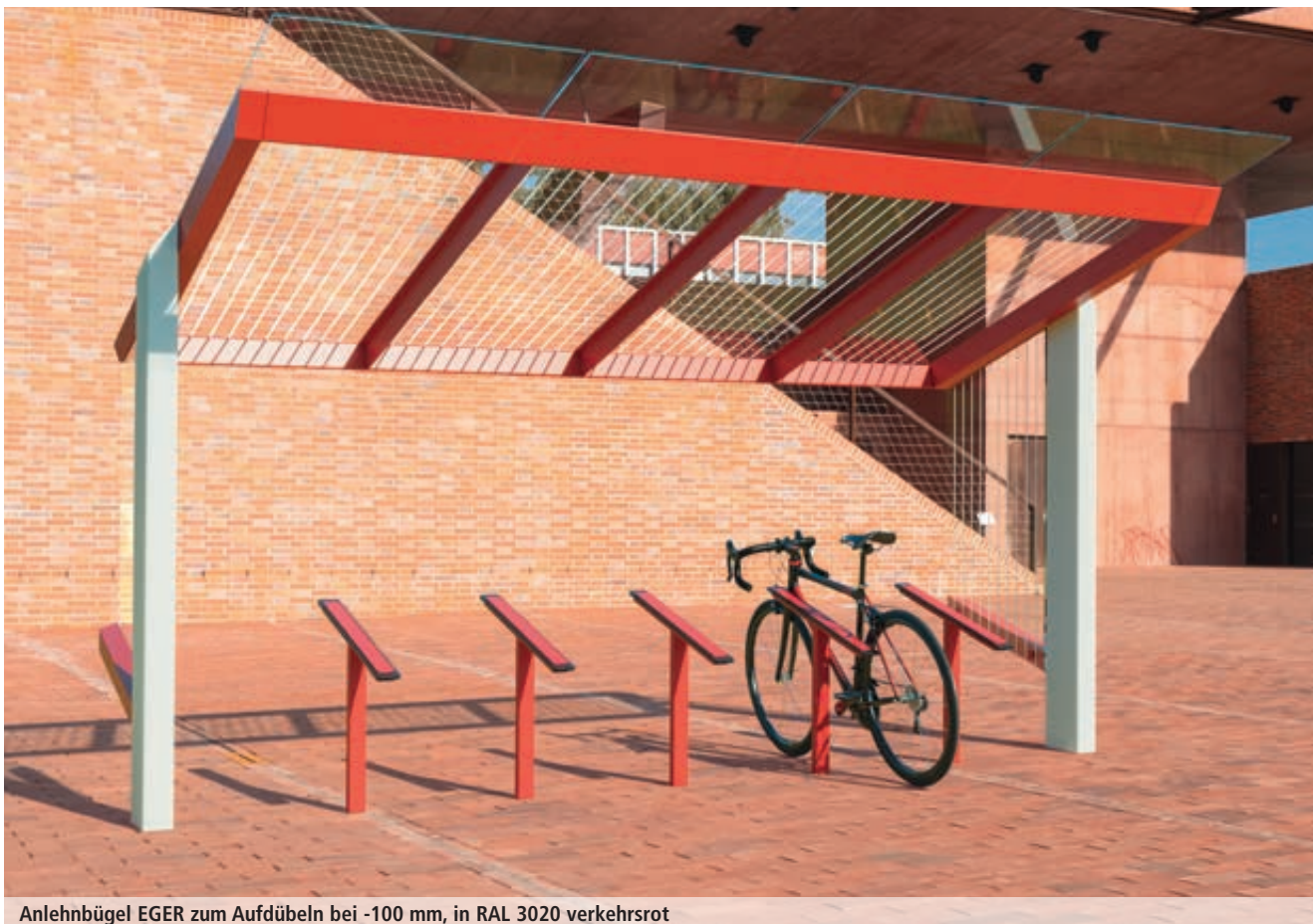
Anlehnbügel EGER zum Aufdübeln bei -100 mm, in RAL 3020 verkehrsrot

Formschön, funktional, schonend und hochwertig zugleich – so präsentiert sich der Anlehnbügel EGER. Im oberen, schräg angesetzten Bügelelement sind rundum widerstandsfähige Gummistreifen integriert, die das Fahrrad vor Lackschäden schützen. Der Anlehnbügel aus feuerverzinktem Stahl mit Pulverbeschichtung ist in vielen verschiedenen Farben erhältlich.