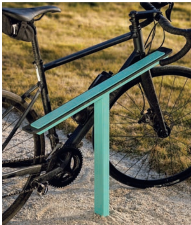
Anlehnbügel EGER zum Aufdübeln bei -100 mm, in RAL 6027 lichtgrün