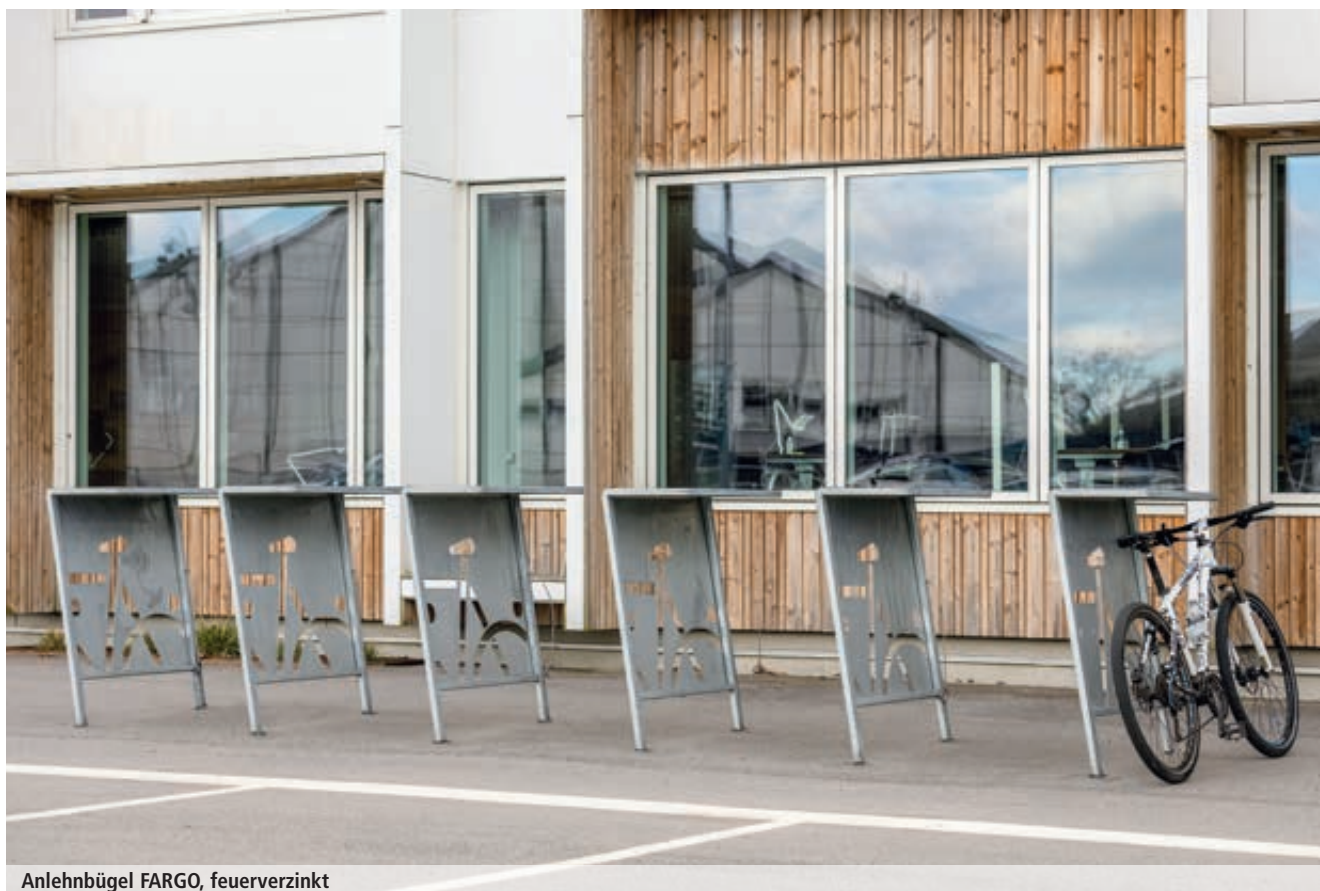
Anlehnbügel FARGO, feuerverzinkt

Der Anlehnbügel FARGO ist die ideale Wahl für moderne städtische Umgebungen. Sein zeitgemäßes Design fügt sich harmonisch vor öffentlichen Gebäuden, in Wohngebieten oder an Arbeitsstätten ein, wo Sicherheit und Stil gleichermaßen gefragt sind. Egal, ob in belebten Stadtvierteln oder ruhigen Wohngebieten, FARGO vereint praktische Funktionalität mit zeitlosem Chic.