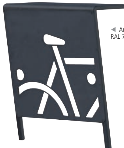
◀ Anlehnbügel FARGO, in RAL 7016 anthrazitgrau