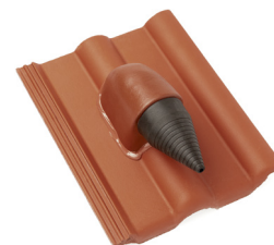
Solar-/Kabeldurchgang (ø bis 70 mm)