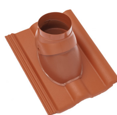
Abgasrohrdurchgang (ø 116 mm oder 128 mm)