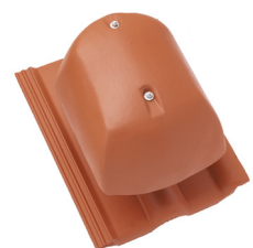
Lüfter DN 160 inkl. Anschlussrohr, Schablone und Anschlussring Plus