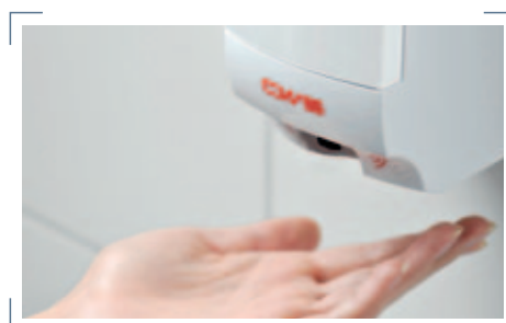
Die Ausgabe des Paradise Disinfection Gels erfolgt berührungslos.

Biozide sicher verwenden. Vor Gebrauch stets Kennzeichnung und Produktinformation lesen.