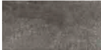
MMXY MEMENTO20 TORTORA 50X100