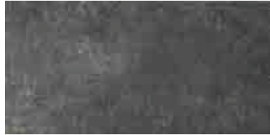
MMXW MEMENTO20 ANTRACITE 50X100 RETT.