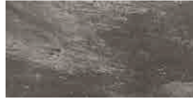
MMXQ BEOLA20 ANTRACITE 50X100