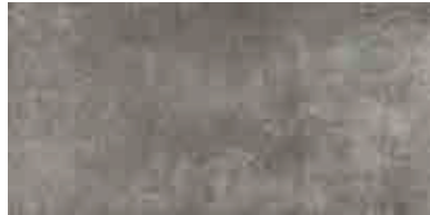
MMXX MEMENTO20 GRIGIO 50X100