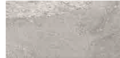
MMXN BEOLA20 GRIGIO 50X100