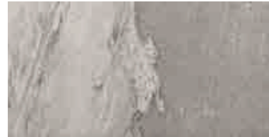
MMXP BEOLA20 GREIGE 50X100