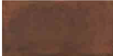
MMXU COTTOTOSCANA20 ROSSO 50X100