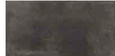
MMXT COTTOTOSCANA20 GRIGIO SCURO 50X100