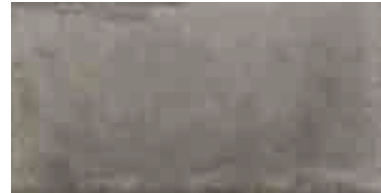
MMXS COTTOTOSCANA20 GRIGIO CHIARO 50X100