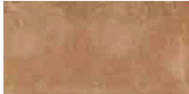
MMXV COTTOTOSCANA20 ROSA 50X100

Conforme/According to/Conforme Gemäß/Conforme/Соответствует UNI EN 14411 - G B1a