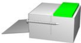
Bild 2: optimaler unterer Fensteranschluss mit dem PR013 Anschlussprofil