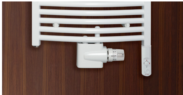
Ausführung Mixbetrieb mit E-Patrone DBM (Zubehör) und Anschluss-Armatur Zehnder Vario