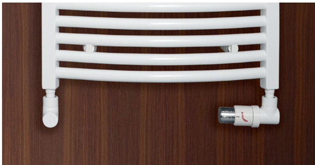
Ausführung Warmwasserbetrieb mit Anschlüssen rechts, links.