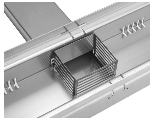
Ansicht Draintec Rinne mit der Anschlussstück und Stichkanal