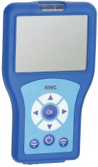
Bidirektionale Fernbedienung für F3 und F5 Armaturen

Spülarmaturen | Elektronische Urinalspülarmaturen