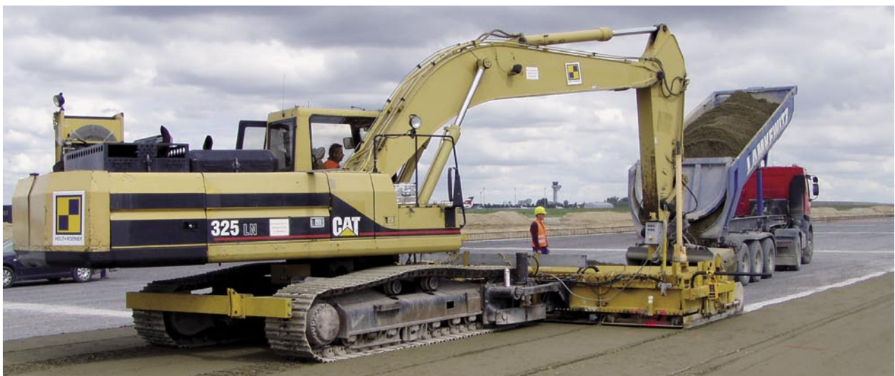
Bild 1: Einbau einer hydraulisch gebundenen Tragschicht mit Multi-Talent

Im Baumischverfahren wird dem zur Verfestigung vorgesehenen und verdichteten Boden oder Baustoffgemisch an Ort und Stelle die erforderliche Bindemittelmenge mit einer Fräse zugemischt. Das Bindemittel wird mittels eines Zementstreugeräts mit guter Dosiereinrichtung ausgestreut und nachfolgend untergemischt. Noch fehlendes Wasser ist erst nach dem ersten Mischgang oder bei Eingangsmischern während des Mischgangs zuzugeben. Die Wasserzugabe erfolgt entweder durch Wassersprengwagen oder durch einen