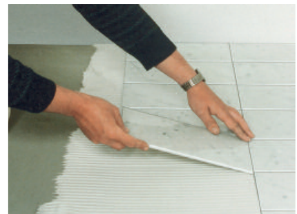
PCI Carraflex für die anwendungssichere Verlegung von Natursteinplatten und Marmor.