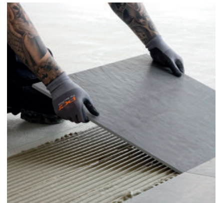
PCI FT Extra verfügt auch bei der Bodenverlegung über einen hohen Verarbeitungskomfort.

5 Fliesen und Platten mit schiebender Bewegung im Kleberbett ansetzen und ausrichten.