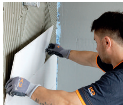
Mit PCI FT-Extra können Fliesen auf der alternativen Abdichtung PCI Lastogum® sicher verlegt werden.