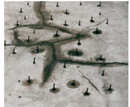
Risse vergießen und hohl liegenden Estrich verpressen mit PCI Apogel F.