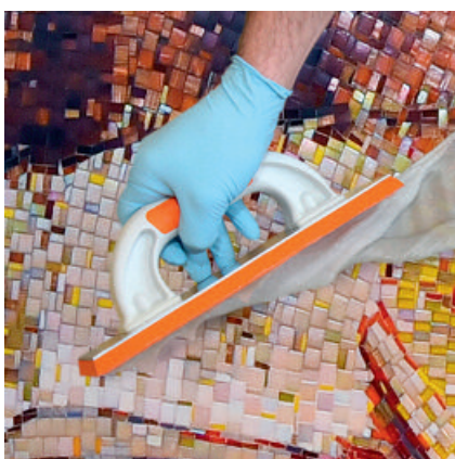
PCI Durapox® Premium Harmony mit einer Hartgummifugscheibe in die Fugen einbringen.

PCI Durapox® Finish entfernt werden. Stärkere Verschmutzungen sind mit PCI Spezial-Reiniger Epoxi abzureinigen.