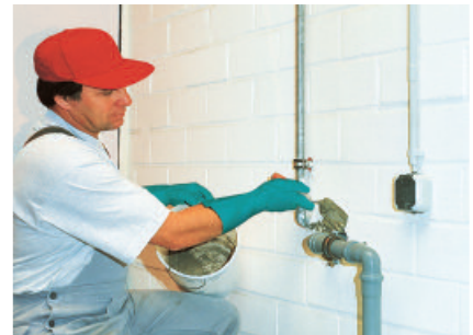
Der Blitz-Zement-Mörtel PCI Polyfix 5 Min. ist leicht zu verarbeiten und nur mit Wasser anzumischen.