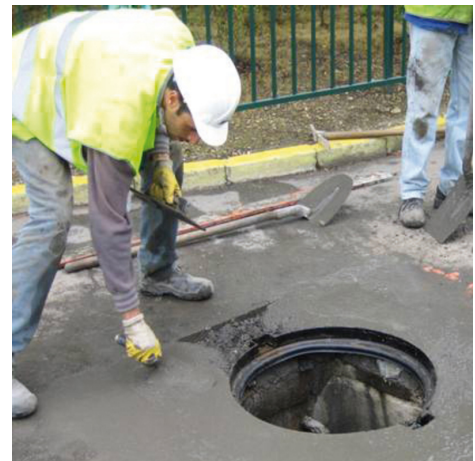
Einbetten eines Schachtringes mit PCI Repafast Tixo