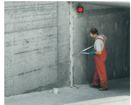
Mit PCI Apogel PU werden wasserführende Risse schnell abgedichtet.