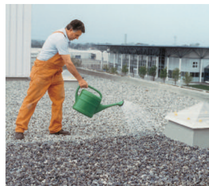
PCI Stabiflex verfestigt Kiesschüttungen auf Flachdächern und verhindert Kieswanderungen.