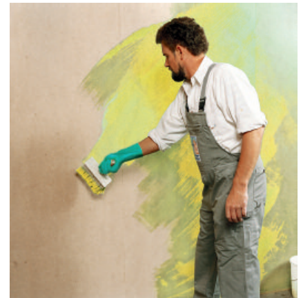
PCI Wadian als Wasserdampf bremsende Grundierung auf Holzspanplatten vor der Fliesenverlegung.