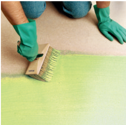
1. PCI Wadian im Kreuzgang oberflächendicht auf den Untergrund auftragen.