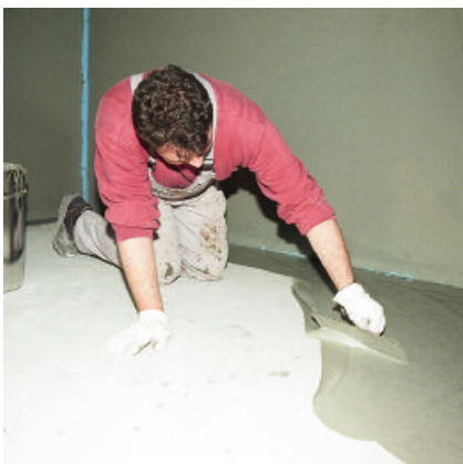
4. ... oder der zementären Sicherheits-Dichtschlämme PCI Seccoral