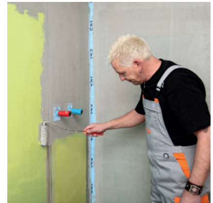
3. Nach Trocknung der PCI Wadian-Spezialgrundierung können Flächen mit der wasserdichten, flexiblen Schutzschicht PCI Lastogum ...