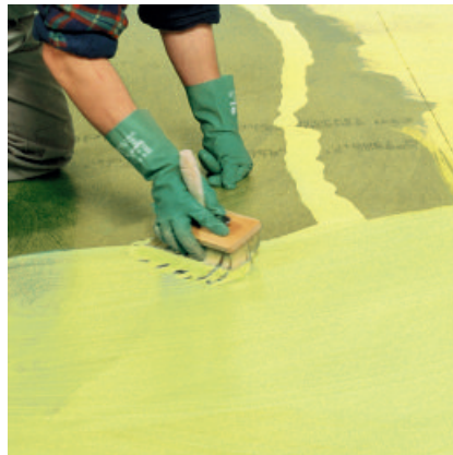
2. Nach einer Ablüfzeit von ca. 30 Minuten zweiten Anstrich oberflächendicht aufbringen.