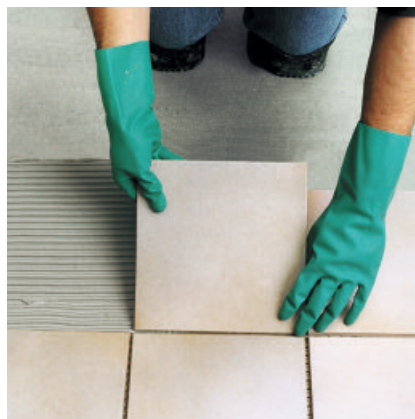
5. der Entkopplungsplatte PCI Polysilent oder den PCI Pecilastic Bahnen überarbeitet werden. Auf dieser Abdichtungs- bzw. Entkopplungsschicht können nach deren Trocknung Fliesen und Platten verlegt werden (siehe Tabelle).