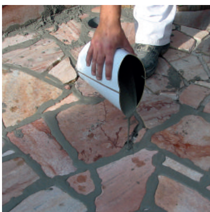
Pavifix CEM Rapid mit einem geeigneten Gießgefäß in die vorbereiteten Fugen einbringen.