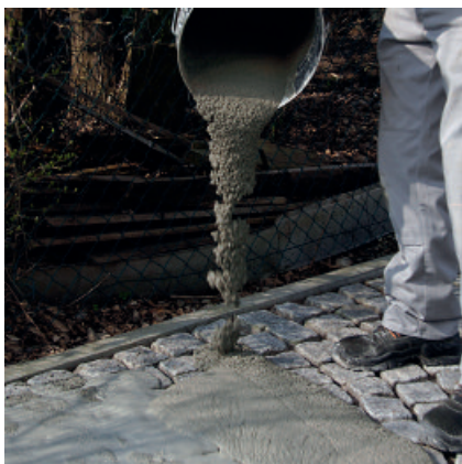
Aufbringen von PCI Pavifix CEM Rapid auf die sorgfältig vorgemätschte zu verfugende Fläche.