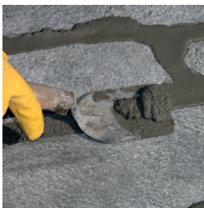
Nach Anziehen des Mörtels (Fingerkuppentest) Überstand mit einer Spachtel abstechen.