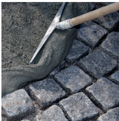
PCI Pavifix CEM Rapid mit einem Gummischieber in die Fugen einarbeiten. Die Belagsoberfläche mit einem leichten Sprühstrahl feucht halten.