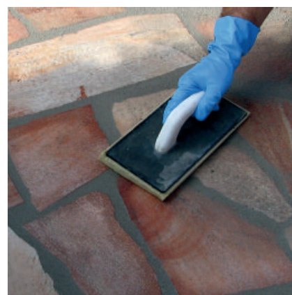
Anschließend Plattenbelag mit einem Schwammbrett nachwaschen.