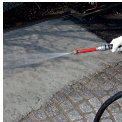
Anschließend erfolgt das Abreinigen mit dem Wasserschlauch. Um beim Reinigen der Pflastersteine ein Ausspülen der Fugen zu vermeiden, ist der Wasserstrahl nahezu horizontal zur Oberfläche zu halten.