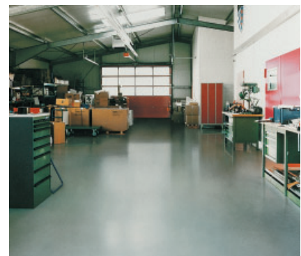
PCI Apoten-Beschichtung in einem Gewerbebetrieb mit hoher mechanischer und chemischer Belastung.