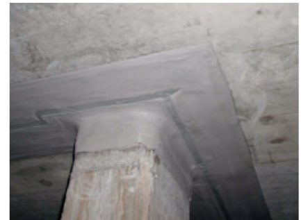
PCI Pectape 3000 - Abdichtungsband mit PCI Barrafix EP verklebt.