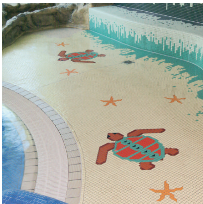
PCI Durapox NT und PCI Durapox NT plus sind geeignet für den Einsatz im Schwimmbad.

Angemischten Reaktionsharz-Fugemörtel auf die zu verfugenden Beläge auftragen, mit PCI Gummifugenscheibe einschlämmen und diagonal abziehen.