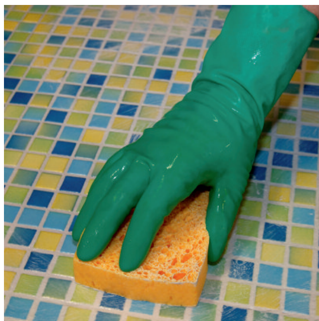
Waschen der verfugten Beläge mit PCI Epoxi-Schwamm fein.