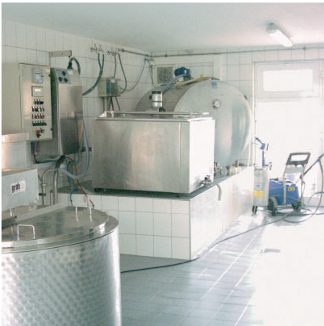
Hochverschleißfestes und chemikalienbeständiges Verlegen und Verfugen von Keramikbelägen, z. B. in Molkereien.

Druckbedingte Farbabweichungen vorbehalten.