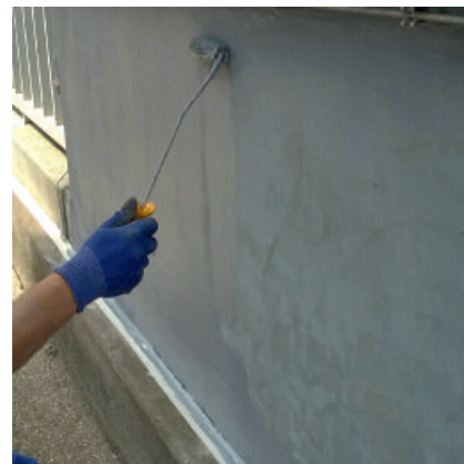
PCI Betonfinish W schützt und verschönt Beton- und Putzfassaden.